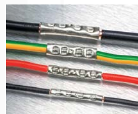
ukázka lisování pevných drátů (0,5 - 6 mm 2 )