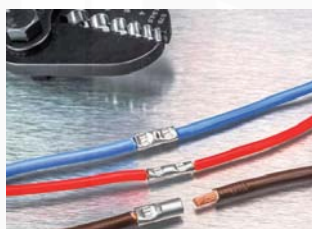
ukázka lisování spojek (krátká verze) pro jemně laněné vodiče (0,5 - 6 mm 2 )