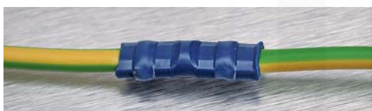
ukázka symetrického lisování kleštěmi "WILDCAT Exclusive 2"