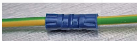
ukázka asymetrického lisování kleštěmi "X-MASTER 3129"