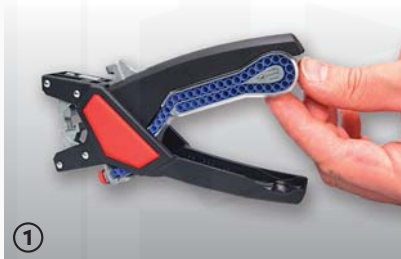
① výměna zásobníku