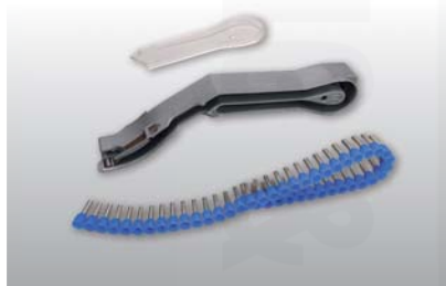
vyměnitelný zásobník pro lisovací dutinky v pásech