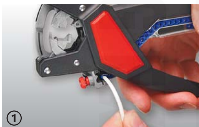
① osazení dutinkou a následně krimpování