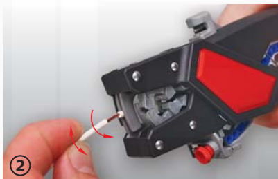
② slaňování lanka