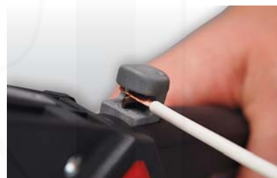
zastříhávání nebo stříhání Cu lanek do 2,5 mm