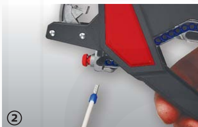
② osazení dutinkou a následně krimpování