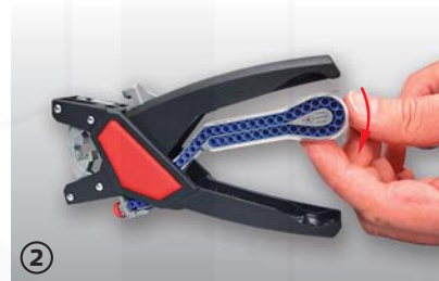
② výměna zásobníku