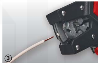
③ slaňování lanka