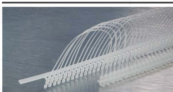
provedení přichytek "HAWKER SEAL" v pásech pro montáž pomocí prošívacího nářadí "HAWKER GUN"

Pro připevňování informačních nebo identifikačních štítků k výrobkům.