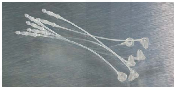
provedení přichytek "HAWKER SEAL" jako samostatné kusy pro ruční montáž bez nářadí