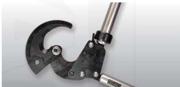
Mechanické ráčnové pákové nůžky "MEGAN Solid" na stříhání Cu, Al, Fe tyčí a AlFe lan