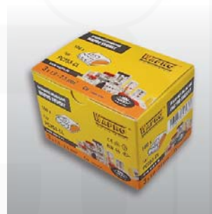
praktické balení svorek