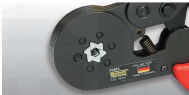
ukázka šestihránného lisování kleštěmi "FENIX"