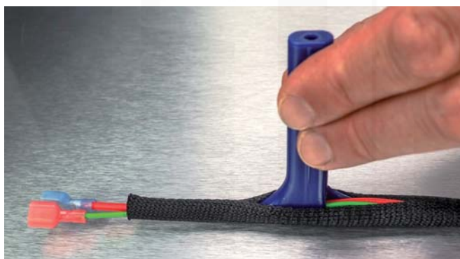
ukázka montáže ochranných opletů