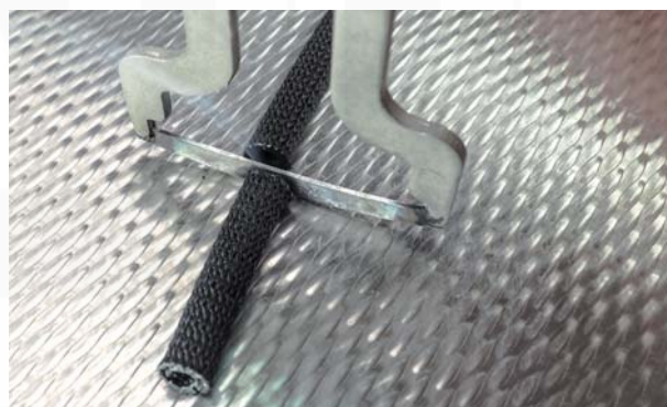
ukázka stříhání ochranných opletů horkým nožem