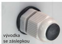
vývodka se zásepkou