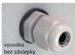
vývodka bez zásepky