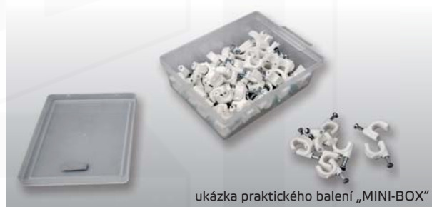
ukázka praktického balení „MINI-BOX“

Např. kabelové rozvody, elektroinstalace, telekomunikace atd.