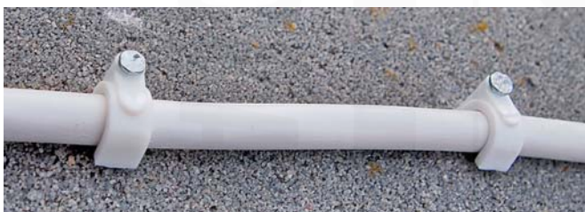
ukázky použití přichytek "MATRIX U1" v tvrzeném betonu a ve dřevě