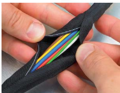
ukázka použití ochranných opletů