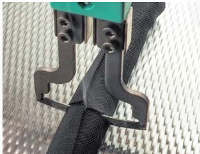
ukázka stříhání ochranných opletů horkým nožem