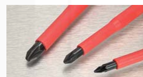
detail magnetických hrotů