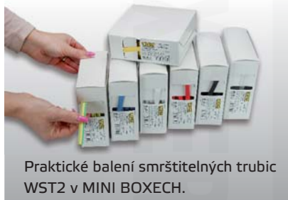
Praktické balení smrštitelných trubíc WST2 v MINI BOXECH.