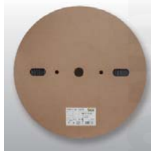
Ukázka balení smrštitelných trubíc WST2 v návínu na cívce.