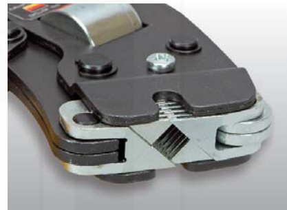
detail samonastavitelných čtyřhranných čelistí