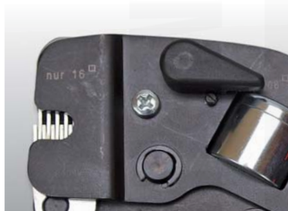
poloha páčky pro rozsah krimpování 0,08 - 10 mm 2 (pouze u kleští ASTON X16)