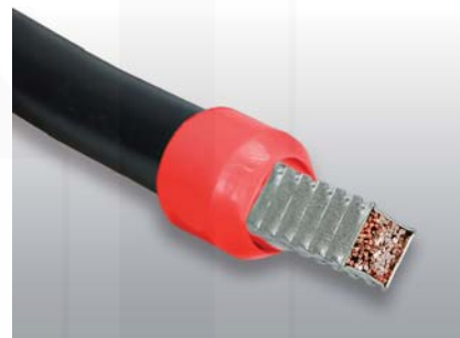
ukázka čtyřhranného lisování