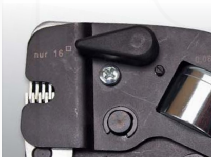
poloha páčky pro krimpování 16 mm 2 (pouze u kleští ASTON X16)